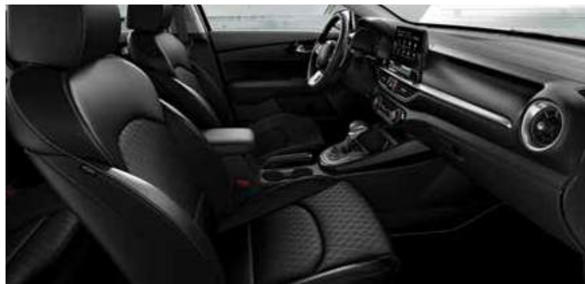
EX _جلد أسود