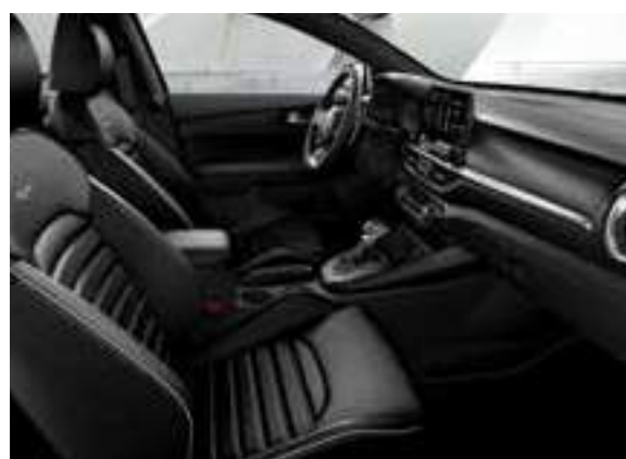
GT-Line _جلد أسود