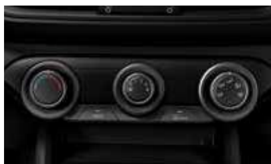
نظام تحكم يدوي لدرجة الحرارة