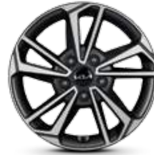
مقاس 16 بوصة R16 55/205 إطارات من الألومنيوم لون رهادي ميتاليك داكن