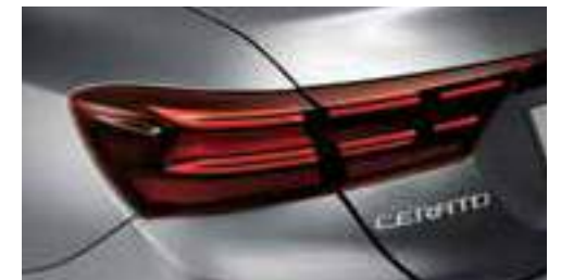
مصابيح LED خلفية