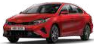
أحمر مُتدرّج اللمعان (CR5)