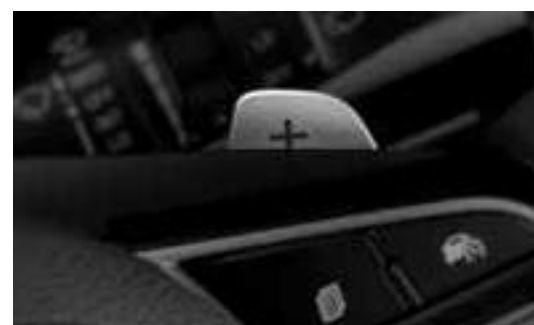
رافعات أذرع تبديل