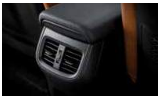
فتحة تهوية للركاب بالخلف

ما المزايا التي تجعل من السيارة سيراتو الاختيار المثالي للقيادة والسفر؟ يمكنك اختيار الميزات الإضافية الملائمة لك، مثل الصوت والرفاهية والتشغيل التلقائي التي تعكس تفضيلاتك، تؤكد من أن كل دقيقة تقضيها في السيارة سيراتو هي وقت مميز.