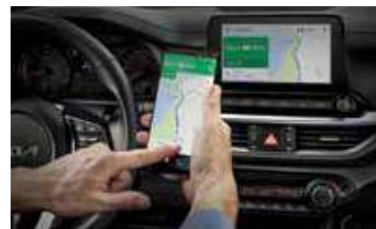
نظام Android Auto