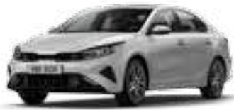
فضي لدمع (4SS)