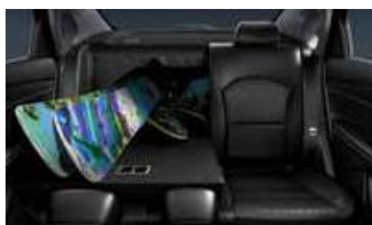
مقاعد قابلة للطي 60:40