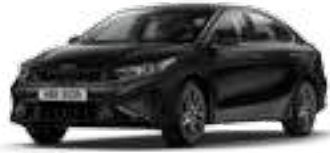
لؤلئي أسود فاتح (ABP)