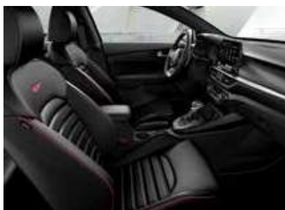
GT _جلد أسود