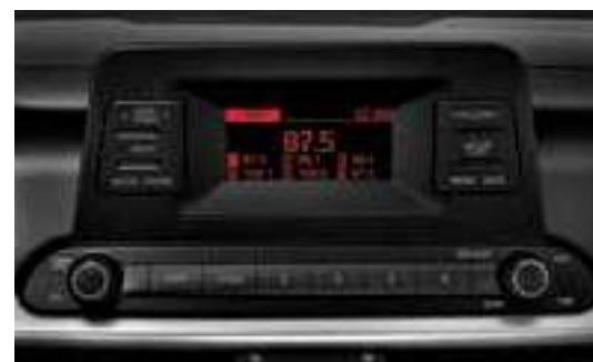
نظام صوت مدمج ذو شاشة عرض قياس 3.8 بوصات