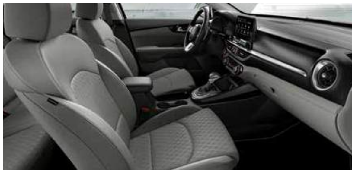
EX _جلد رمادي

اختر ما يلائمك من المقاعد الناعمة والمبنية المتوفرة في مجموعات جذابة من قماش أو قماش وجلد. فكل اختيار طمّم للتوافق مع السمات والتفاصيل الجمالية بالتصميم الداخلي للسيارة سيراتو: مما يمنحك تجربة مريحة وملائمة جداً داخل السيارة.