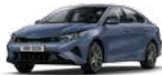
أزرق متوسط (BBL)