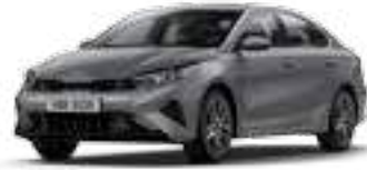
رهادي فولاذي (KLG)