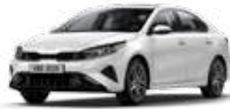
لؤلئي أبيض كالثليج (SWP)