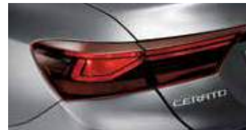
مصابيح تقليدية خلفية