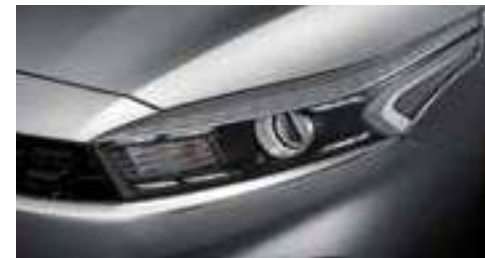
مصابيح أمامية تقليدية مع مصابيح LED للتشغيل النهاري