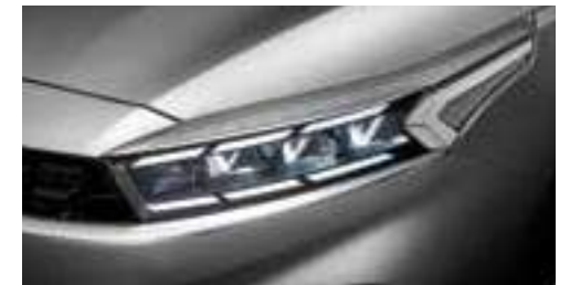
مصابيح LED أمامية كاملة