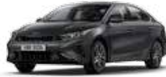
رهادي بلاتينيوم (ABT)