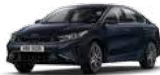
أزرق داكن (B4U)