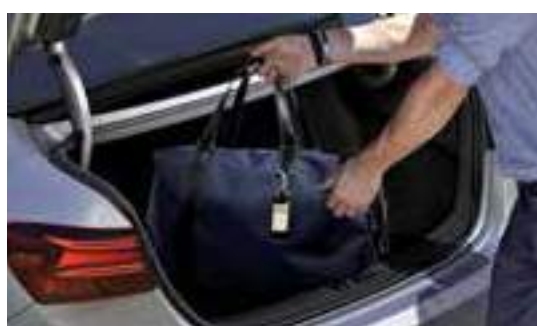
502 لتر سعة الحمولة