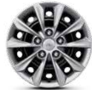
مقاس 15 بوصة R15 65/195 إطارات من الحديد (غطاء العجل)