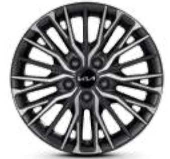
مقاس 17 بوصة R17 45/225 إطارات من الألومنيوم لون رهادي ميتاليك داكن