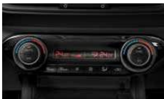
تحكم تلقائي في درجة الحرارة يسمح بنطاق حرارة مختلفين بالسيارة