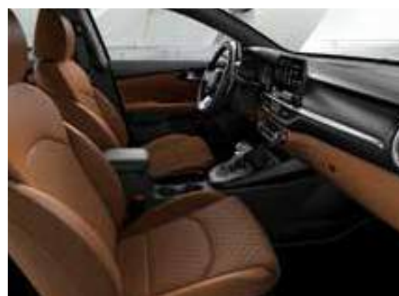
مجموعة اللون البني _جلد بني اللون