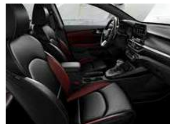
مجموعة اللون الأحمر _جلد أسود وأحمر اللون