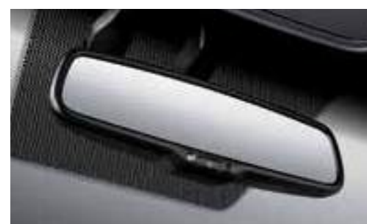
مرآة رؤية خلفية إلكترونية