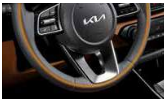
تدفئة عجلة قيادة