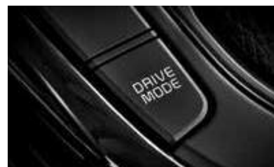
نظام اختيار وضع القيادة (DMS)