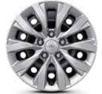
مقاس 16 بوصة R16 55/205 إطارات من الحديد (غطاء العجل)