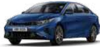
أزرق معدني (M4B)